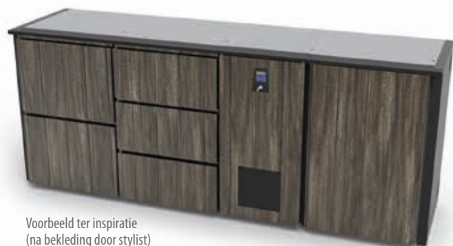
Voorbeeld ter inspiratie (na bekleding door stylist)